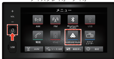
ディスプレイオーディオ