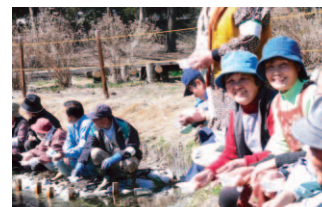
ホタルの里づくり Protecting firefly habitat