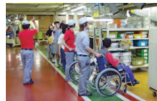
ふれあい見学会 Plant tour for disabled group