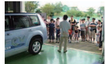
環境施設見学の様子 Environmental facilities tour for local residents