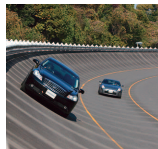
テストコース Tochigi Proving Ground

The plant boasts Nissan's most sophisticated domestic proving grounds, including a 6.5-kilometer (four-mile) high-speed banked oval which encircles the plant, as well as a skid pad, water slalom and a variety of paved and cobbled test courses to help engineers simulate many different driving conditions. All Nissan vehicles are developed using the information gained during the rigorous testing conducted here.