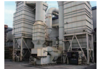
集塵機ファンのインバータ化 (250kWモーター) Inverter control of 250-kW motors powering dust collector fans

The plant communicated the importance of environmental protection through various activities, including a guest lecture at Tochigi Prefecture's Annual Interact Club Conference, an exhibition at an environment event at Teikyo University and tours of its environmental facilities for community residents and companies. Reservations for touring the environmental facilities can now be made online, enabling more people to see the plant's environmental technologies first-hand.