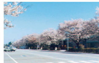
四季を彩る桜並木 Cherry blossoms in bloom at the plant

Plant employees, together with a group of local volunteers known as the Firefly Association, release fireflies along the Iso River that runs near the plant. This activity has been incorporated in science and environmental education in elementary and junior high schools. Tochigi Plant is actively participating in maintaining the habitat and the surrounding environment.