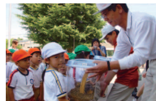
四季だより Messages of the Seasons